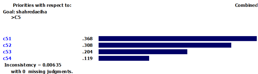
شکل ۶: اوزان شاخص‌های فرعی براساس شاخص «عوامل راهبردی C5»

پس از انجام محاسبات در نرم‌افزار Expert Choice، اوزان شاخص‌های فرعی با توجه به هدف و بر اساس شاخص «عوامل راهبردی C5» مطابق با شکل (۷) به دست آمد. Model Name: dowlate electronic