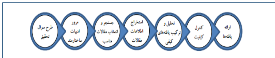
شکل ۱: گام‌های روش فراترکیب (سندلوسکی و باروسو، ۲۰۰۷).

با توجه به اینکه پژوهش حاضر به منظور سامان‌دهی و بهره‌برداری از دانش موجود و شناخت خالهای پژوهشی در مطالعه‌های گذشته از طریق تحلیل نظام‌مند متون انجام شده‌است آن را می‌توان از نوع ثانویه دانست که در آن از منابع ثانویه داده‌ها نظیر کتاب‌ها، مقاله‌ها و مستندها استفاده شد. در واقع پژوهش حاضر از نظر هدف بنیادین و از لحاظ ماهیت داده‌ها و سبک تحلیل جزء پژوهش‌های کیفی به‌شمار می‌رود که در آن داده‌های پژوهش با استفاده از روش فراترکیب ۱ جمع‌آوری و تحلیل می‌شود. فراترکیب نوعی مطالعه کیفی است که اطلاعات و یافته‌های استخراج شده از مطالعه‌های کیفی دیگر را با موضوع مرتبط و مشابه بررسی می‌کند و با فراهم کردن نگرشی نظام‌مند برای پژوهشگران از طریق تلفیق پژوهش‌های کیفی مختلف موضوع‌ها و استعاره‌های نوین را کشف می‌کند، دانش جاری را ارتقاء می‌دهد و نگرشی جامع نسبت به مسائل ایجاد می‌کند (دقتی و همکاران، ۱۳۹۸: ۸۹-۱۲۰). لازم به ذکر است رایج‌ترین الگوهای استفاده شده برای روش فراترکیب الگوی سه مرحله‌ای نوبلت و هیر ۲ (۱۹۸۸)، الگوی شش مرحله‌ای والش و داون ۳ (۲۰۰۵) و الگوی هفت مرحله‌ای سندلوسکی و باروسو ۴ (۲۰۰۷) هستند که در پژوهش حاضر از روش هفت مرحله‌ای سندلوسکی و باروسو (۲۰۰۷) استفاده شد که مراحل آن در شکل شماره ۱ نمایش داده می‌شود.