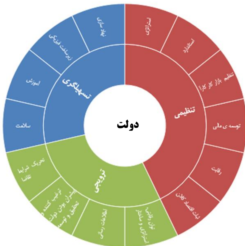
نمودار ۱. مدل نقش‌های دولت در ارتقای مزیت رقابتی صنایع

با توجه به جدول (۲) الگوی مفهومی ارتقای مزیت رقابتی صنایع مطابق نمودار (۱) خواهد بود.