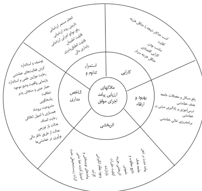
شکل ۲: ملاک‌های ارزیابی پیامد اجرای خطمشی موفق