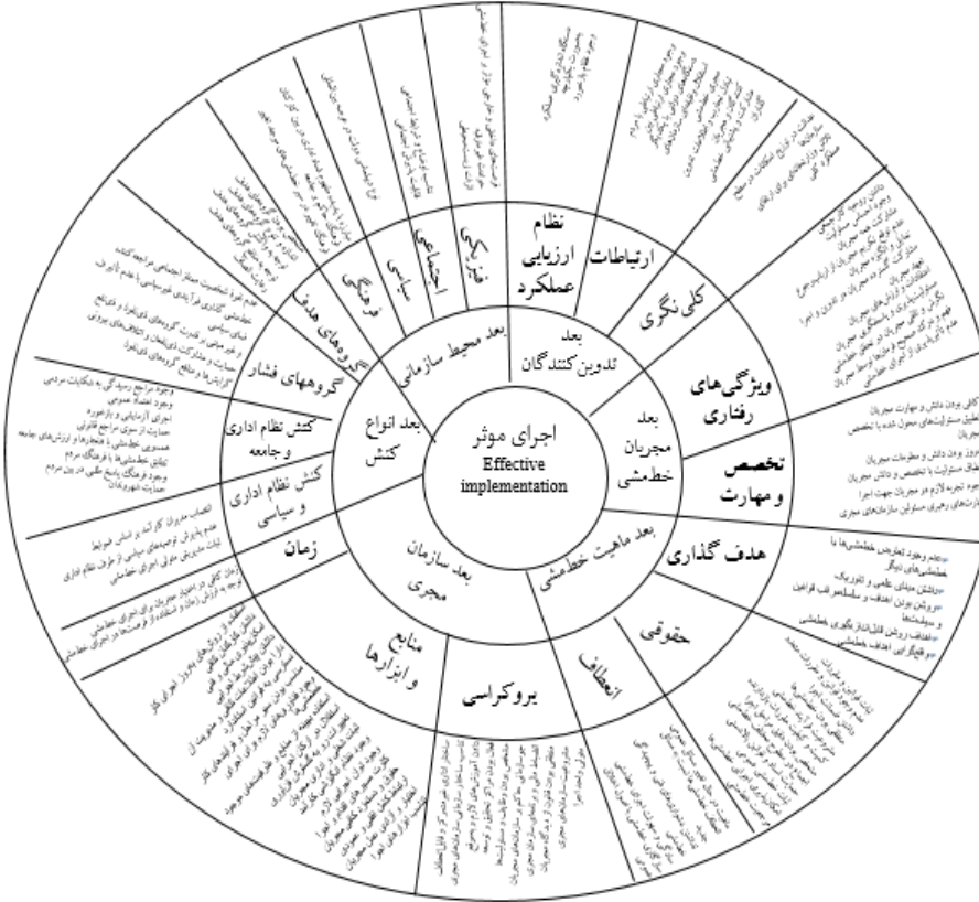
شکل ۱: ملاک‌های ارزیابی اجرای کامل خطمشی