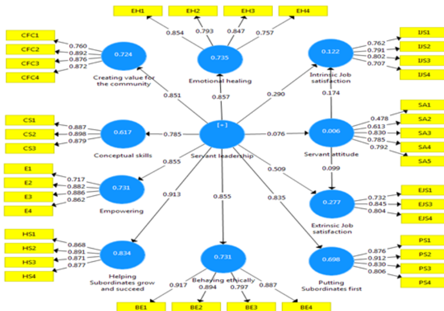
شکل ۲: ضرایب بارهای عاملی مدل مفهومی پژوهش

آزمون فرضیات: در ارزیابی یک مدل ساختاری آزمون فرضیات مدل مسیر، معمولاً یکی از موضوعاتی است که به‌طور دقیق بررسی می‌شود (غیاثوند، ۱۳۹۸). اعداد معناداری t ، ابتدایی‌ترین معیار برای سنجش رابطه بین سازه‌ها در مدل است. در صورتی که مقدار این اعداد از ۱/۹۶ بیش‌تر شود نشان از تأیید رابطه بین سازه‌ها و در نتیجه تأیید فرضیات پژوهش در سطح اطمینان ۹۵٪ است (داوری و رضازاده، ۱۳۹۵). ضرایب مسیر و عدد معناداری فرضیات پژوهش در جدول ۴ آمده است.