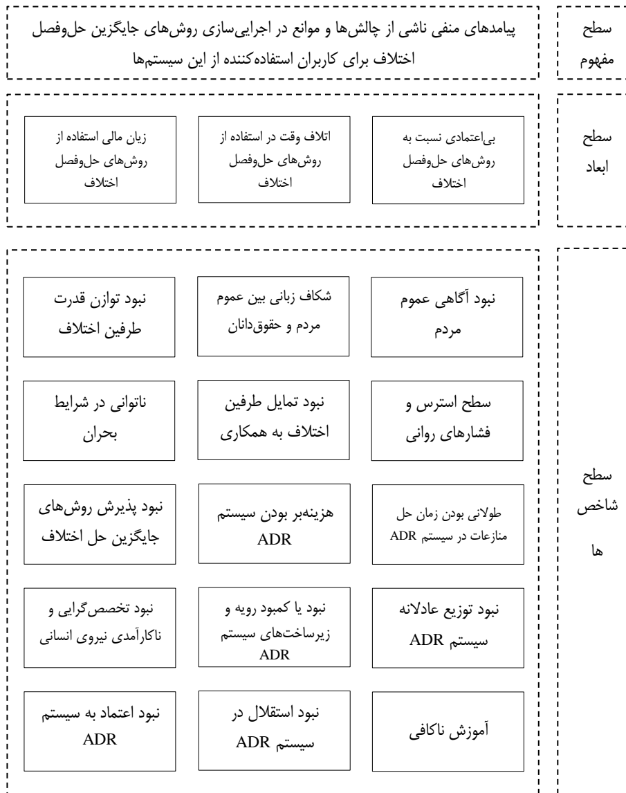
شکل ۱: چارچوب مفهومی پژوهش