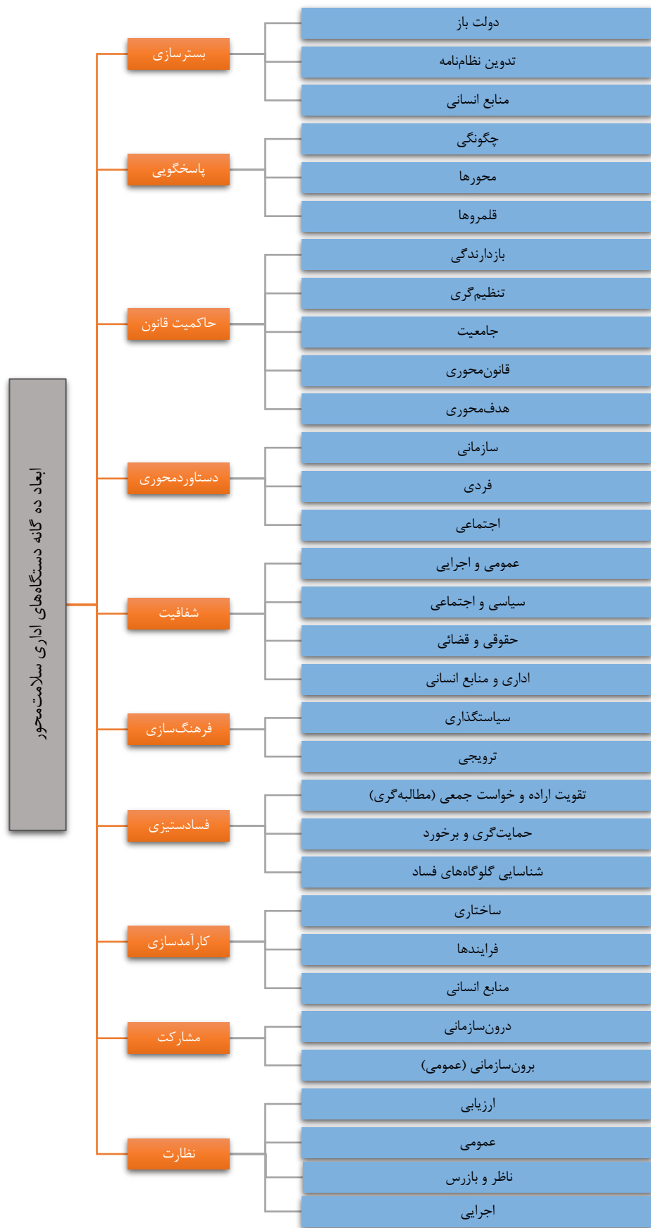
شکل ۲: الگوی سلامت‌محور دستگاه‌های اجرایی