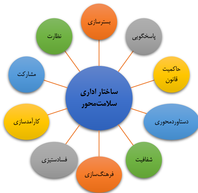
شکل ۱. ابعاد الگوی ساختار اداری سلامت محور

در جدول قبل به نمونه‌ای از داده‌ها و کدهای استخراجی مطالعه اشاره شد. در این مطالعه با بررسی کدهای توصیفی استخراج‌شده در ۲۱۴ کد پایه و ۳۱ مضمون سازمان‌دهنده دسته‌بندی شد. در نهایت، به‌منظور فهم بهتر، مضامین سازمان‌دهنده در ده طبقه به‌عنوان مضامین فراگیر دسته‌بندی شدند.